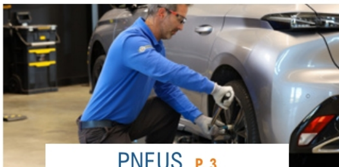
PNEUS P. 3