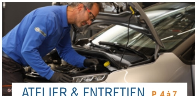
ATELIER & ENTRETIEN P. 4 à 7