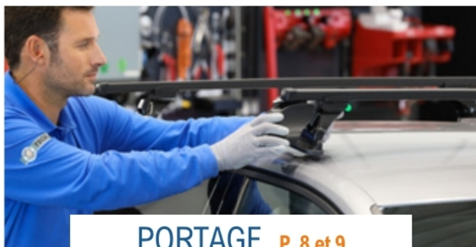
PORTAGE P. 8 et 9