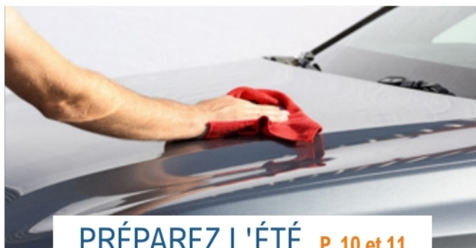
PRÉPAREZ L'ÉTÉ P. 10 et 11